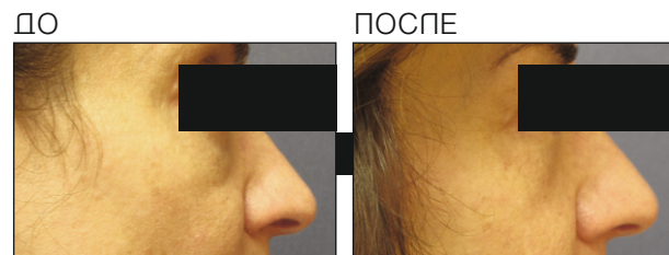
Результаты после 5-ти процедур