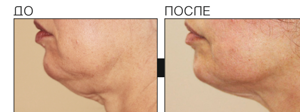
Результаты после 6-ти процедур

Специальный протокол ReLift предназначен для борьбы со вторым подбородком, моделирования контуров лица и улучшения текстуры кожи лица и шеи, делая Вас моложе.