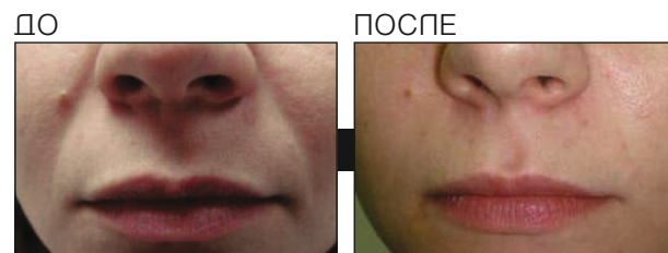
Результаты после 2-х процедур