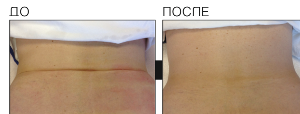
Результаты после 5-ти процедур

НЕ существует лекарства от старения, но есть решение для борьбы с признаками старения, которые заставляют вас выглядеть старше, чем вы себя чувствуете.