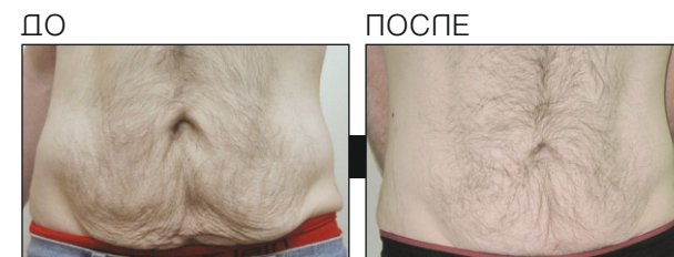
Результаты после 8-ми процедур

Специальный ReFit протокол разработан для решения проблем провисшей и гряблой кожи после большой и быстрой потери кожи, результатом которого будет подтянутая и гладкая кожа.