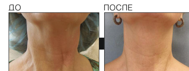
Результаты после 9-ти процедур